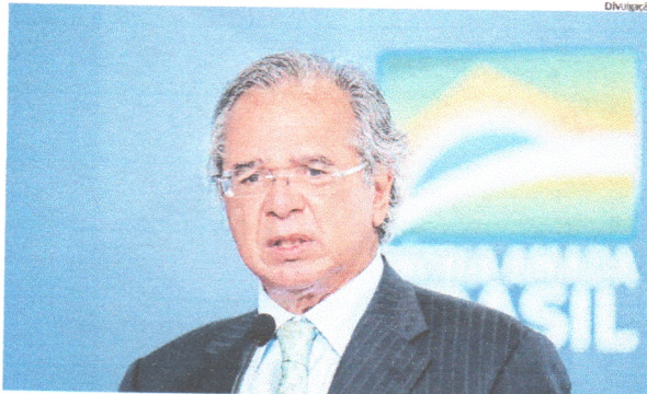
Ministro da Economia Paulo Guedes defende reforma administrativa anunciada pelo presidente Jair Bolsonaro

Guedes disse ainda que sempre foi apoiado pelo presidente "nas horas decisivas" e que não tinha como se opor ao desmembramento do Ministério da Economia, feito para acomodar Onyx Lorenzini que, com as mudanças, sai da Secretaria-Geral do Governo para o novo Ministério do Emprego e Previdência Social. "Deveria recusar ele trazer um aliado político importante? Deveria dizer para deixar o Onyx cair fora do