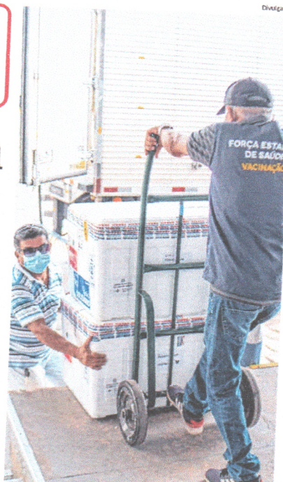
Novos lotes de vacinas chegam para reforçar a imunização no MA