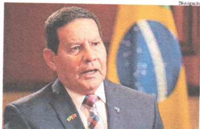
Hamilton Mourão disse que o Brasil não é uma república de banana

O vice-presidente Hamilton Mourão (PRTB) garantiu que haverá eleições em 2022, mesmo sem a implementação do voto impresso, apesar de o presidente Jair Bolsonaro já ter colocado a realização do pleito em dúvida diversas vezes durante sua defesa da alteração no sistema eleitoral. "Nós não estamos mais no século 20. É lógico que vai ter eleição. Quem é que vai proibir eleição no Brasil? Nós não somos república de bananas", disse em conversa com jornalistas ontem. Apesar de adotar tom enfático em defesa da normalidade institucional, declarou-se favorável ao voto impresso e sugeriu que a urna eletrônica utilizada no Brasil é tecnologicamente defasada e precisa ser "evoluída". "O voto impresso, o governo defende esse debate. Eu também sou francamente a favor. Nós usamos uma urna de primeira geração. Argentina, por exemplo, está em uma